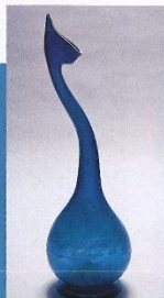
伊朗十八世紀着色瓶。