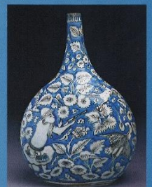
伊朗十七世紀的長頸膽瓶。

一個玻璃藍瓶，彷彿是少女身上的藍色薄紗，隨着微風，在波斯的平原上翩然起舞，變成天空的一片藍，永遠照耀着大地。