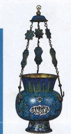
由大衛收藏博物館借出的燈。